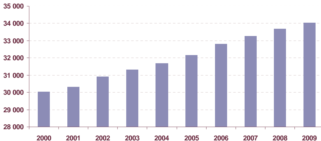
Evolution du nombre d'associations employeurs dans le secteur sanitaire et social

Sources : ACOSS-URSSAF et MSA – Traitement R & S.